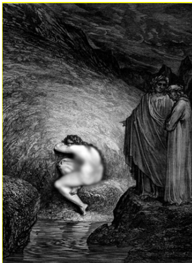
تصویر ۹. میرای تبهکار در وادی هشتم دوزخ،