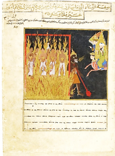
تصویر ۱. زنان بی‌حجب و حیا آویزان از گیسوان خود در وادی هفتم دوزخ،

مأخذ: سایت کتابخانه ملی فرانسه (Supplement turc 190, p123)