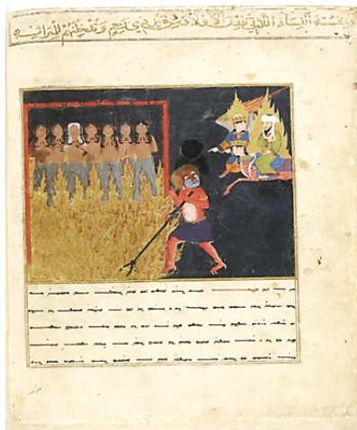
تصویر ۳. زنان زناکار و دارای فرزند نامشروع آویزان از سینه خود در قعرترین وادی دوزخ،

مأخذ: سایت کتابخانه ملی فرانسه (Supplement turc 190, p128)