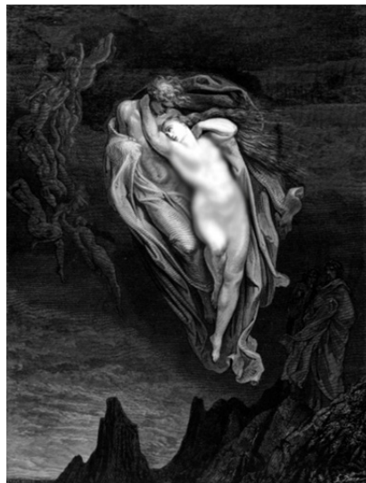
تصویر ۵. جزای رابطه نامشروع و عاشقانه فرانچسکا و پائولو در وادی دوم دوزخ،

دوزخیان این طبقه در معرض طوفانی ابدی قرار دارند، زیرا در زندگانی خود در برابر طوفان امیال و شهوات نفسانی پایداری نکرده و حال در فضایی بسر می‌برند که ظلمانی است. اینان در حیات خود دیده بر روشنی عقل بشری و فروغ الهی بسته بودند (آلیگیری ۱۳۹۷: ۱۱۳)