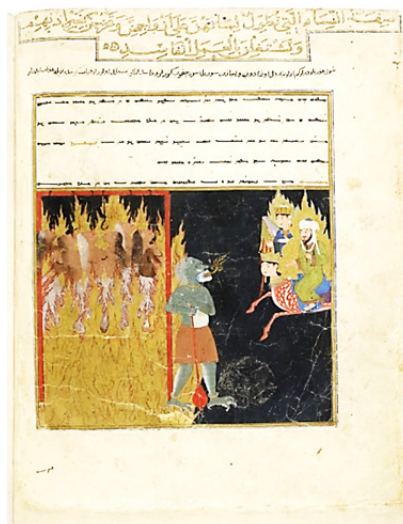
تصویر ۲. زنان سبک رفتار و زشت کردار آویزان از زبان خود در وادی ششم دوزخ،