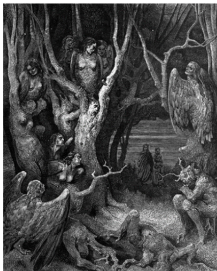
تصویر ۷. آرپی‌ها با بال‌های بزرگ و پهن و بدنی پوشیده از پر در وادی هشتم دوزخ،