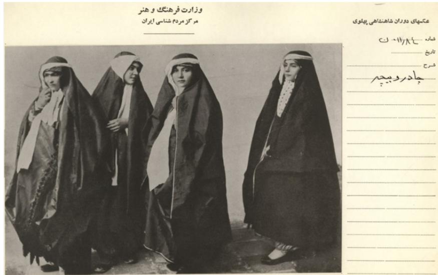
چادر، و بیچه‌هایی که از روی صورت کنار رفته‌اند.