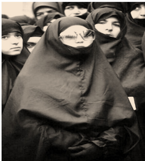
یک نمونه از چادرهای خاص زمان انقلاب

زندگی اجتماعی چادر در ... (فردوس شیخ السلام و عباس وریج کاظمی) ۱۷۳