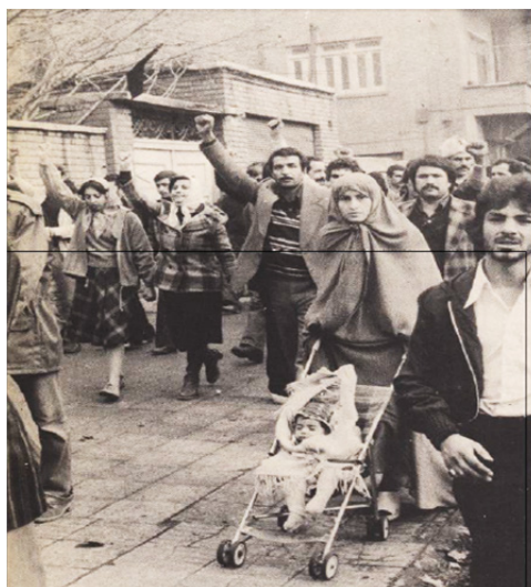
بعضی زنان هم چادر را زیر گلو گره می‌زدند.